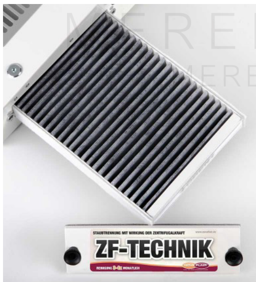
Joonis nr 2

Seade, mille põhifiltri element on välja tõmmatud ja avaga filtri vahetamiseks